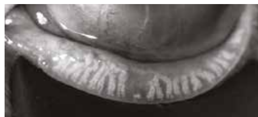
LipiScan™ van de Meiboomklieren