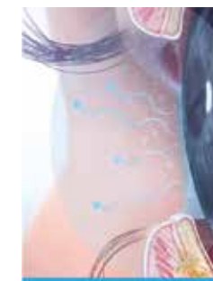
Water verdampt. Dit veroorzaakt roodheid, droogte, irritatie, brandende ogen en oogvermoeidheid.