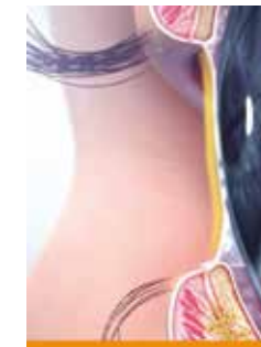
Beschermend waterlaagje geproduceerd door traanklier.

Oogdruppels of andere behandelingen kunnen een tijdelijke verlichting opleveren. LipiFlow® biedt verschil op de lange termijn. De unieke behandeling past een gepatenteerde verwarmingstechnologie toe op de oogleden. Tegelijkertijd gaat een massage verstopping van de klieren tegen.