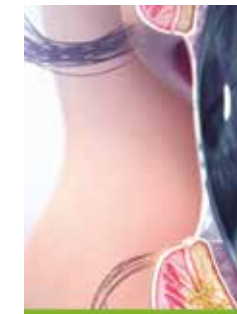
Water wordt beschermd door olie. Geproduceerd door Meiboomklieren in de oogleden.